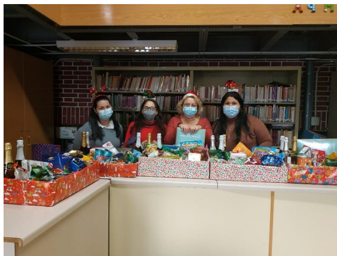
Colaboradoras del AMPA elaborando las cestas para el sorteo.

Os dejamos estas fotos de la preparación y entrega de las cestas: