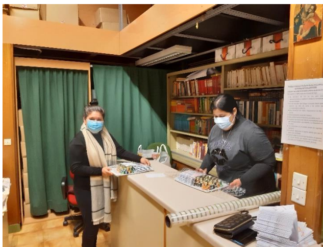
Colaboradoras del AMPA preparando las felicitaciones de Navidad

Os dejamos unas fotos de esta fantástica actividad: