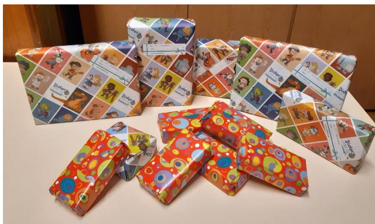
Regalos para los ganadores de cada curso