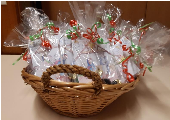
Cesta con las felicitaciones de Navidad y los bombones